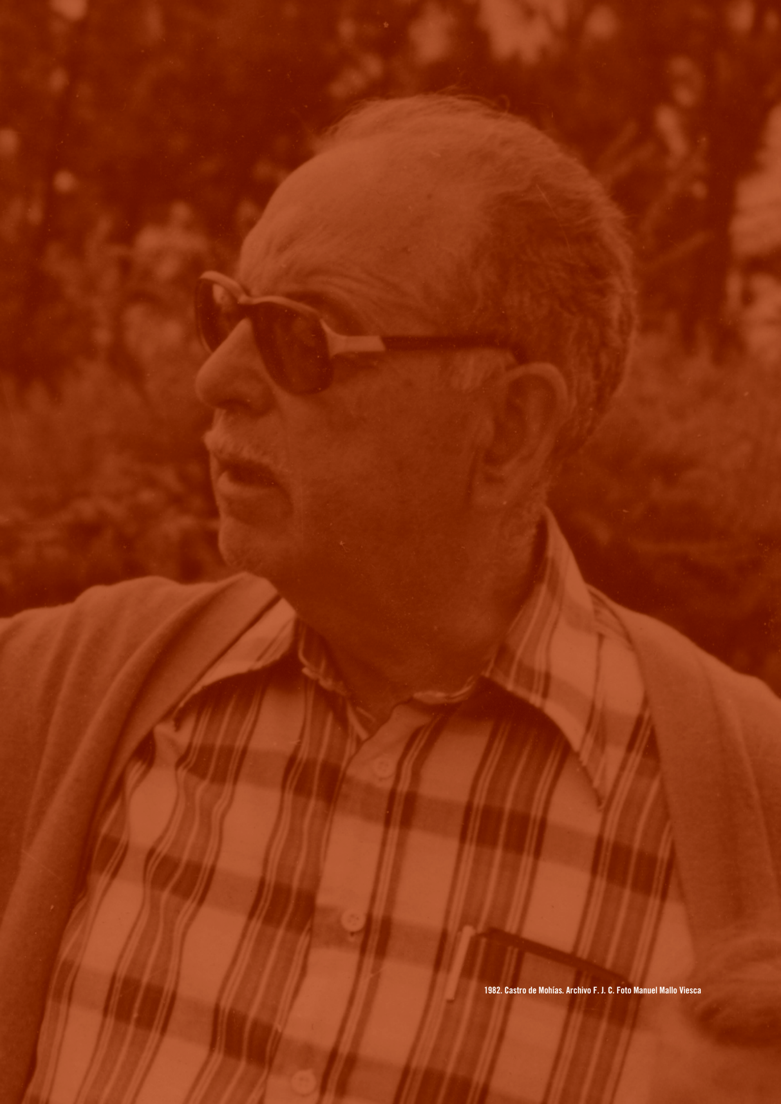
1982. Castro de Mohías.