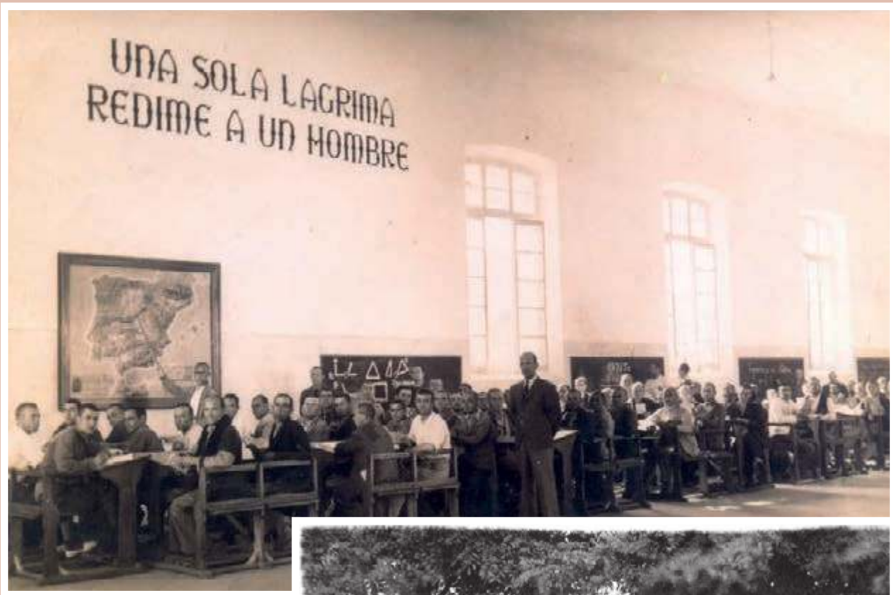
1942. Penal de Burgos.