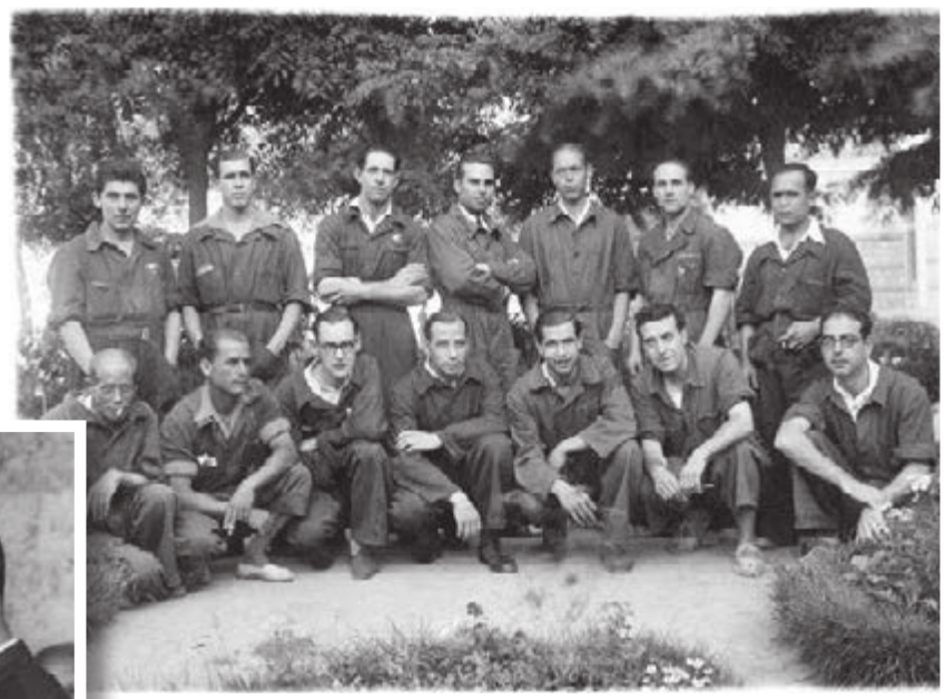
1942-1943. Penal de Burgos.