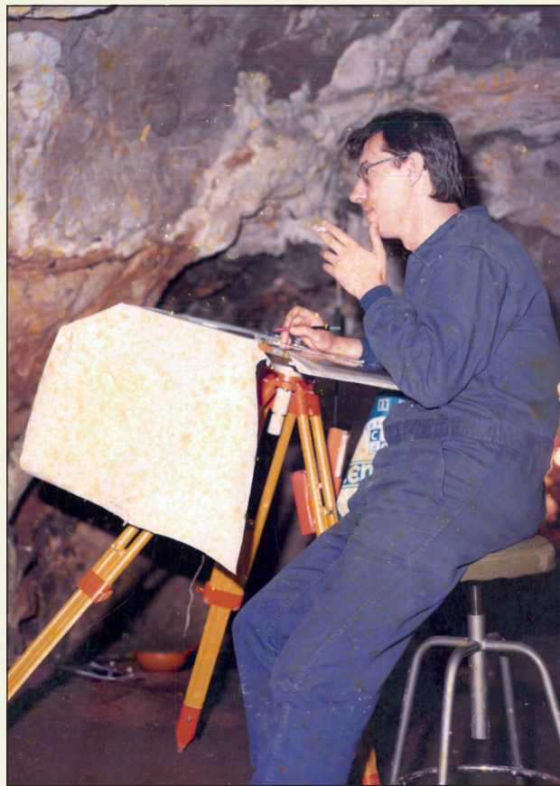
Figura 2. La Lluera I (Asturias). Restitución de los grabados.