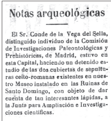
Figura 2. Un ejemplo de las investigaciones inéditas del Conde es este estudio realizado en Pontevedra en 1917, el momento en el que volvió a excavar el dolmen de Santa Cruz de Cangas. El Diario de Pontevedra, 21 de junio de 1917:2

la vida de sociedades y organismos como la Sociedad Española de Antropología, Etnografía y Prehistoria (Sánchez Gómez 1990:61-87), la Real Sociedad Española de Historia Natural (Gomis 1998:18-30), la Junta de Parques Nacionales (Gaceta de Madrid del 11 de agosto de 1929:1152) o el Comité de Patronato que dirigió el Museo de Historia Natural y Antropología y el Jardín Botánico durante la República (Gaceta de Madrid del 18 de julio de 1931:541-542), le convirtieron en una persona muy solicitada en diversos ámbitos sociales y culturales, lo que provocó sin duda una actividad epistolar muy intensa durante varias décadas, que hemos comenzado a descubrir desde hace no mucho tiempo.