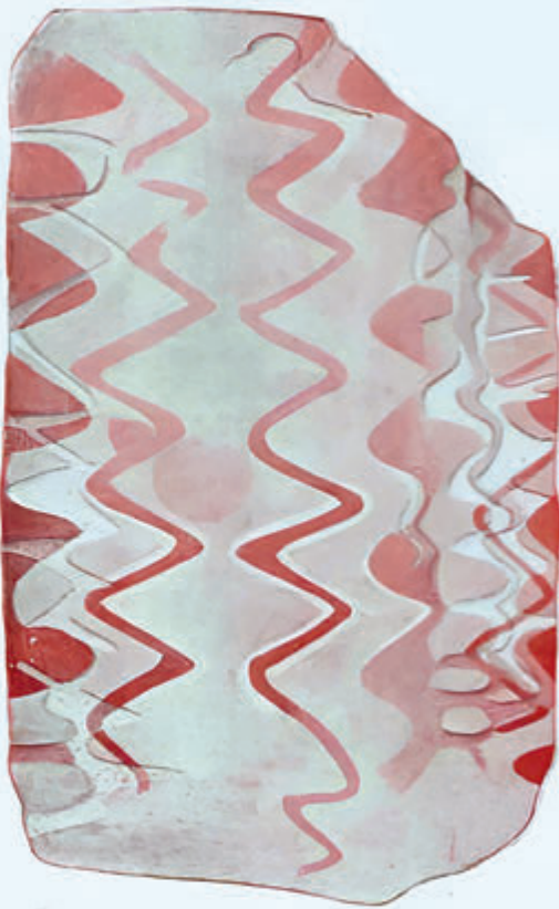
Pintura de la piedra dolménica de la Capilla de Santa Cruz de Cangas de Ons (Núm. 282 del Catálogo.)