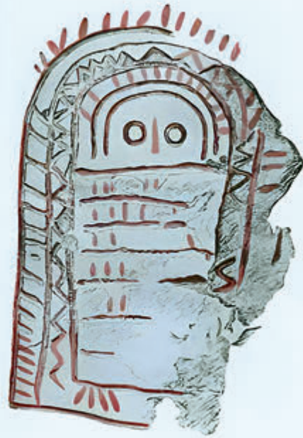
Pintura principal de Peña Tu. (Núm. 202 del Catálogo.)