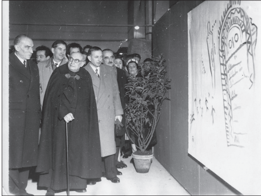
Figura 5. Un anciano H. Breuil ante el calco de Peña Tú. Museo de Prehistoria de Santander, Congreso UISPP, 1954.

de casi dos centenares. [...] Un itinerario a Oviedo permitió visitar el Museo y monumentos de esta ciudad y las cuevas de El Pindal, El Buxu y San Román de Candamo 47 .