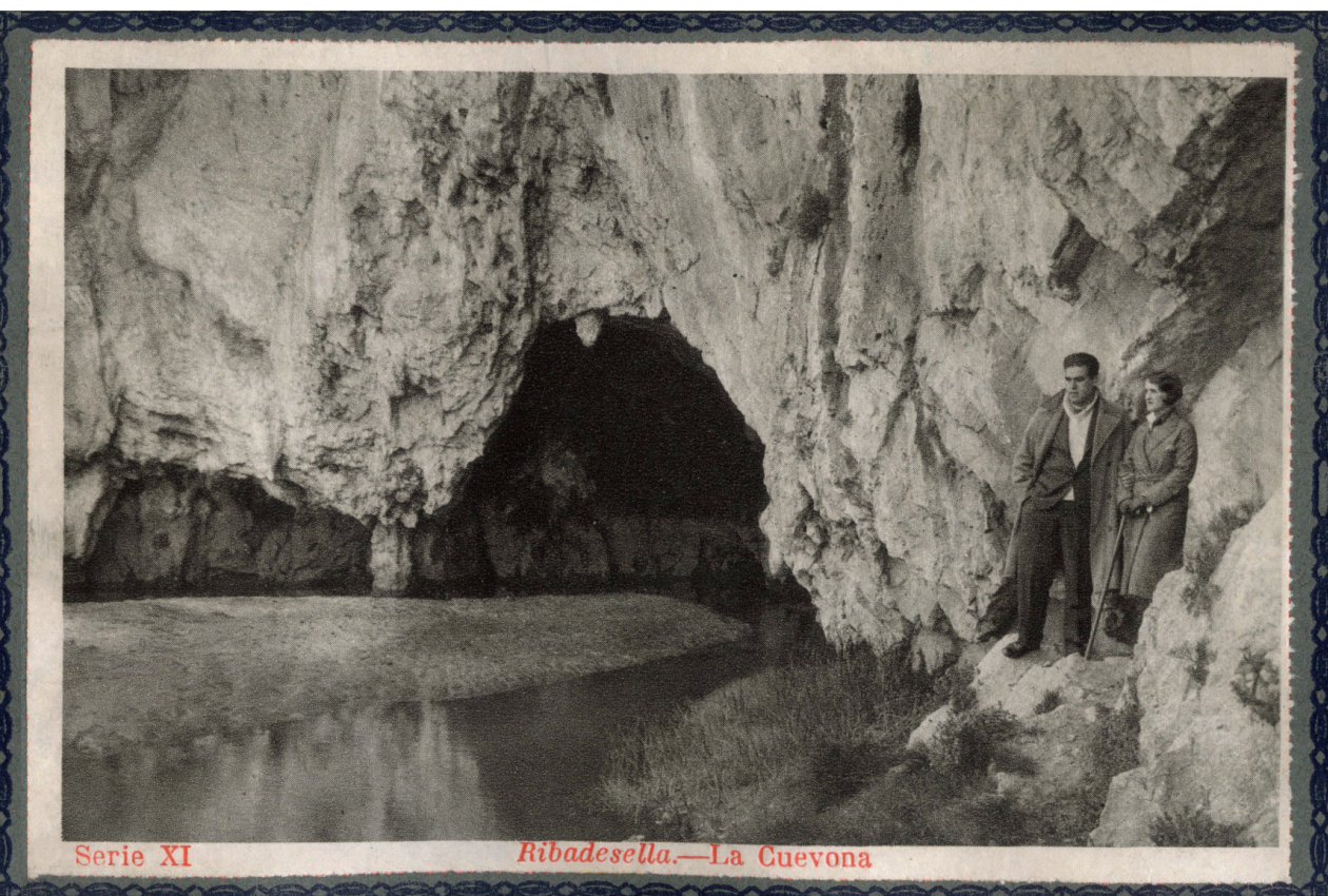
Figura 6. Salida del río San Miguel en lo que actualmente es la entrada al túnel artificial de acceso a Tito Bustillo. Álbum Bellezas de Asturias. España turística y monumental , editado por Juan Gil Canellas, 1933.

de las mismas de modo que pueda atenderse con la debida eficacia a su protección, conservación y administración, procurando así mantenerla íntegra para nuestro Patrimonio artístico y alejada de toda iniciativa o finalidad que pudiera perjudicar su contemplación y estudio. Para ello, lo más adecuado es crear un Patronato que bajo la inmediata dependencia del Ministerio de Educación y Ciencia se forme con la representación de éste y la de las Corporaciones públicas y privadas de la provincia, Organismos y Entidades de carácter cultural y cuantas personas, individuales y jurídicas puedan contribuir por cualquier razón al mejor cumplimiento de los fines pretendidos. En su consecuencia [...] se crea el Patronato de las Cuevas y yacimientos prehistóricos de Asturias, en el que se comprenden las siguientes: Ruinas de un poblado de Coaña; Cueva de Pindal, de Ribadedeva; Cueva de la Peña, de Candamo; Peña Tu de Vidiago, Llanes; Cueva del Carmen, de Ribadesella; Caverna del Buxu, de Cangas de Onís; Caverna del Mazo, de Peñamellera Baja, y Caverna