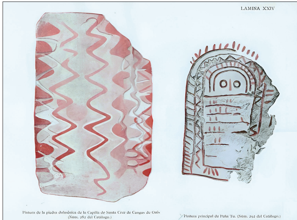
Figura 3. Reproducciones de las pinturas del Dolmen de Santa Cruz (Benítez Mellado) y del Ídolo de Peña Tú (J. Cabré). Catálogo de la Exposición de Arte Prehistórico Español, 1921.

Prehistórico Español (Catálogo 1921) contó con una sala dedicada al arte de la región cantábrica (Sala 1), en la que se expusieron copias y calcos de los grabados y pinturas, así como fotografías y planimetrías realizadas por la CIPP y el IPH en las cuevas asturianas de Candamo (doce reproducciones, trece fotografías y dos planos), El Buxu (nueve reproducciones, tres fotografías y un plano), El Bolado (una reproducción), La Loja (una reproducción y un plano) y El Pindal (siete reproducciones y un plano). Igualmente, en la Sala 4, diferenciados del ámbito del arte paleolítico, se mostraban en el expositor de la Sociedad de Amigos del Arte, entidad organizadora, una reproducción de las pinturas interiores del Dolmen de Santa Cruz y una reproducción y una fotografía de Peña Tú.