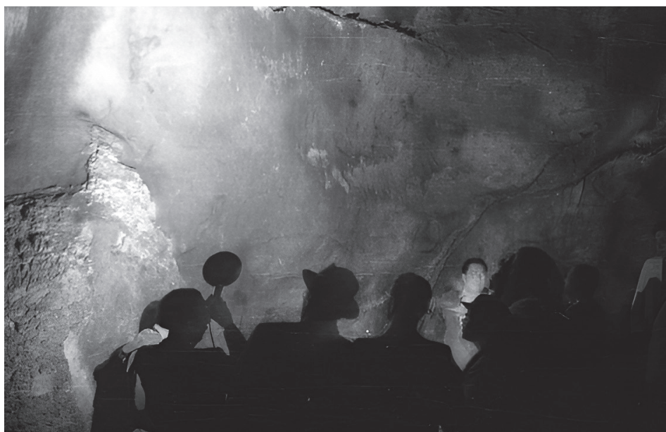
Figura 4. Grupo de visitantes ante el Muro de los Grabados de la cueva de La Peña de Candamo, en 1951.

protección de la cueva acaba derivando en los años 30 en la Junta Mixta para la explotación y administración de la Gruta de Candamo, formada por personas del concejo (alcalde, secretario, maestro y párroco) y de la Junta Provincial de Turismo. Esta Junta será la encargada de «administrar los créditos concedidos [por el PNT] para la habilitación turística de la gruta prehistórica y percibir el importe de las entradas 38 ». Igualmente, se interesará tanto por la instalación de luz eléctrica como por la construcción de la carretera de acceso a la cueva, asuntos que continuarán vigentes en las décadas siguientes.