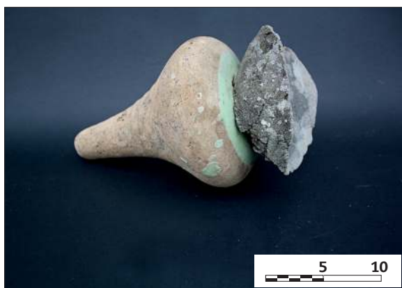
Figura 7. Botijuela 6. Detalle en el que se aprecia el vidriado sobre el hombro de la pieza.

hollín, lo que nos hace pensar que era una de las piezas que se encontraba colocada sobre la chimenea de la casa de la calle del Pozo (Figura 8).