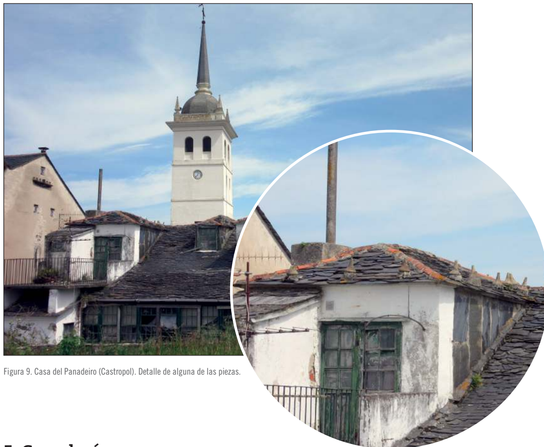
Figura 9. Casa del Panadeiro (Castropol). Detalle de alguna de las piezas.