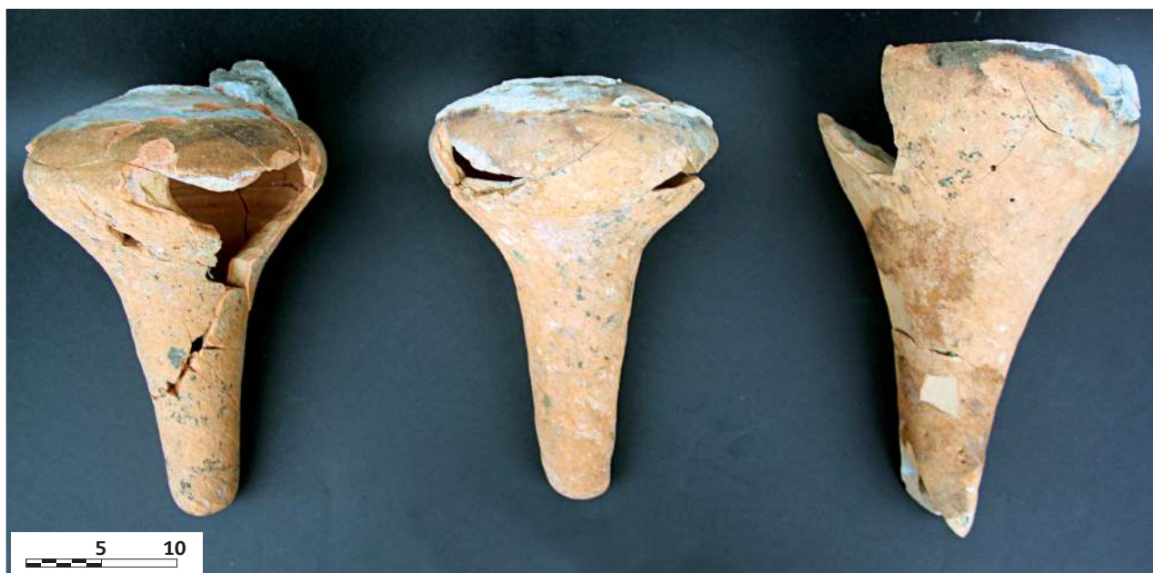
Figura 3. De izquierda a derecha, botijuelas 1, 2 y 3

A consecuencia de esas circunstancias, se decidió retirar la otra pieza situada en el tejado de la misma vivienda (Figura 6: botijuela 6), y que también se presenta en este artículo.