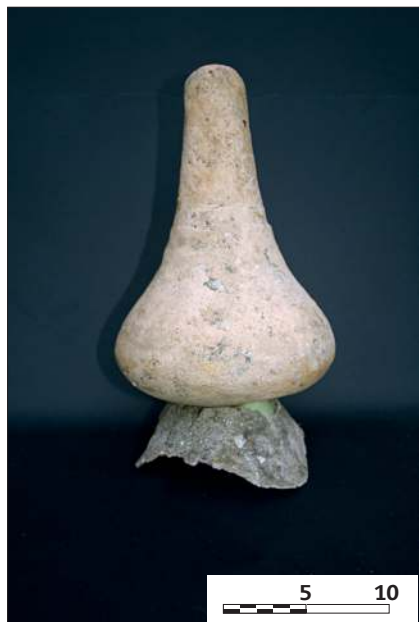
Figura 6. Botijuela 6