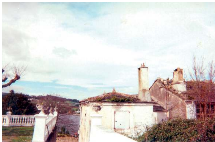
Figura 8. Casa de Marinia de Primote (Castropol), de la cual proceden las botijuelas 2 y 3. La fotografía fue sacada por el autor unos años antes de que colapsase el tejado.

rias piezas de Lekeitio, Bilbao, Pasaia y Elorrio en Vizcaya, y de San Sebastián, Getaria, Bergara y Hondarribia en Guipuzkoa (Azcarate y Nuñez 1990-1991:153-182; Benito 1987: 139-145; 2003:505, 507).