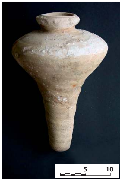
Figura 5. Botijuela 5

Las dos últimas piezas (Figuras 2, 4 y 5: botijuelas 4 y 5) proceden de otra vivienda castropolense conocida como Casa del Panadeiro (Figura 9), situada en la calle Penzol Lavandera, popularmente llamada calle de la Procesión. En este caso, y aunque esta vivienda posee sobre su tejado una amplia colección de estos contenedores, las dos botijuelas que se presentan aquí se encontraban resguardadas en el interior de la casa, junto a otras piezas que finalmente no pudimos estudiar.