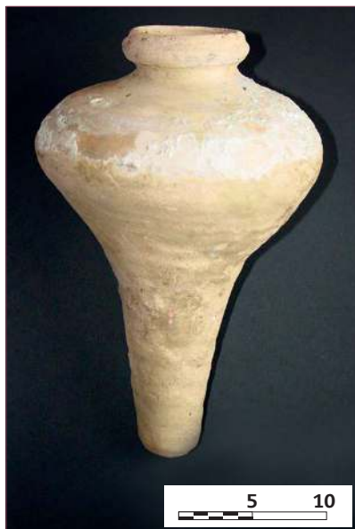
Figura 4. Botijuela 4