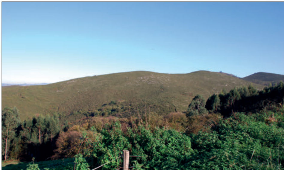
Figura 5. Plataforma cimera de la Sierra del Naranco.

De estos topónimos se identifican sin duda Lignum (>Lliño), Villa Constantii (>Costante), Suego (>L'Iría Siegu) 12 , Porciles (probablemente aludido en >Tres Porciles) 13 , Gamoneto (>El Gamonal) 14 y Obrias (>Obrís). Como El Gamonal se encuentra al este de Obrís, inmediatamente al noroeste del lugar de El Contriz, se impone deducir que Cugullos se ha de encontrar entre ambas y que Porciles inicia la serie de hitos para el deslinde desde el este por la cimera del Naranco. Este dato parece incluir los aprovechamientos ganaderos del sector occidental de la plataforma cimera de la sierra (Figura 5), excluyendo todo el sector oriental de la misma, probablemente por formar parte de la villa de San Vicente (identificada con San Vicente de Villaperi, en la vertiente septentrional del monte), también donada en 908 (Valdés Gallego 2000:496), y que devino históricamente en otro cellero de San Salvador según atestigua el Libro del Prior del ACO (García-Sampedro 2008:40-46). Del mismo modo, los hasta ahora ilocalizados Ianuale y Avienco han de ubicarse en la línea que desde el límite con Costante sube hacia la cumbre hasta topar con la braña de Porciles, pues al este de Costante se sitúa Villamaxil, lugar ajeno al dominio inicial, por estar repartido entre diversos