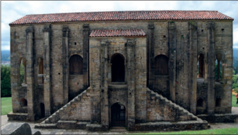
Figura 3. Santa María de Naranco.