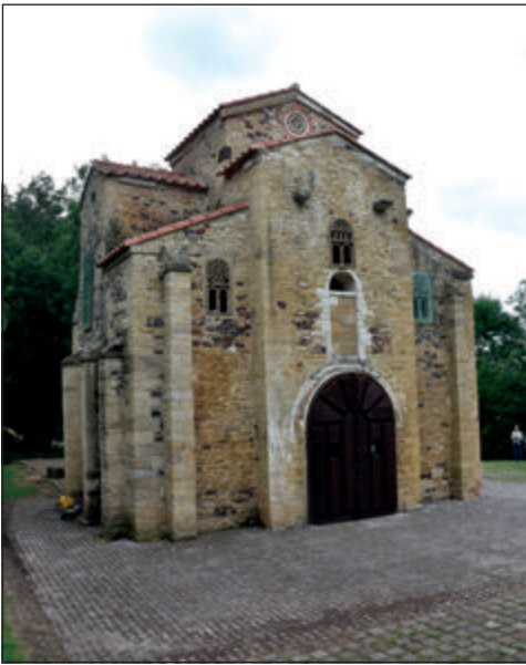
Figura 4. San Miguel de Lliño.

La ubicación de ambos edificios, Santa María (Figura 3) y San Miguel (Figura 4), hubo de responder a la preexistencia de un dominio cuyos límites pueden ser grosso modo establecidos a partir de la toponimia actual, la topografía y la documentación medieval. En efecto, Naranco se encuentra entre los fundi 4 de Constantius –cristalizado en el topónimo Costante ( villa Constantii ), emplazado a unos 550-600 m en línea de aire al este de Santa María– y el de Ermesindus ( villa Ermesindi ) –evolucionado a Villarmosén, situado a unos 2200 m al oeste de San Miguel–. Se trata en ambos casos de la evolución romance de dos originales topónimos latinos, compuestos por un sustantivo en nominativo – villa – y sendos genitivos latinos de possesor , el primero dotado de nomen latino y el segundo de nomen gótico, pero declinado en latín, lo que indica que como tal nomen había sido incorporado al repertorio onomástico latino usado por los moradores del Naranco en el momento. La presencia del nomen de origen godo aporta un terminus post quem para su aparición, no anterior al siglo VI, y con mayor probabilidad ya del VIII (Piel y Kremer 1976:119-123). En lo referente al étimo latino, no