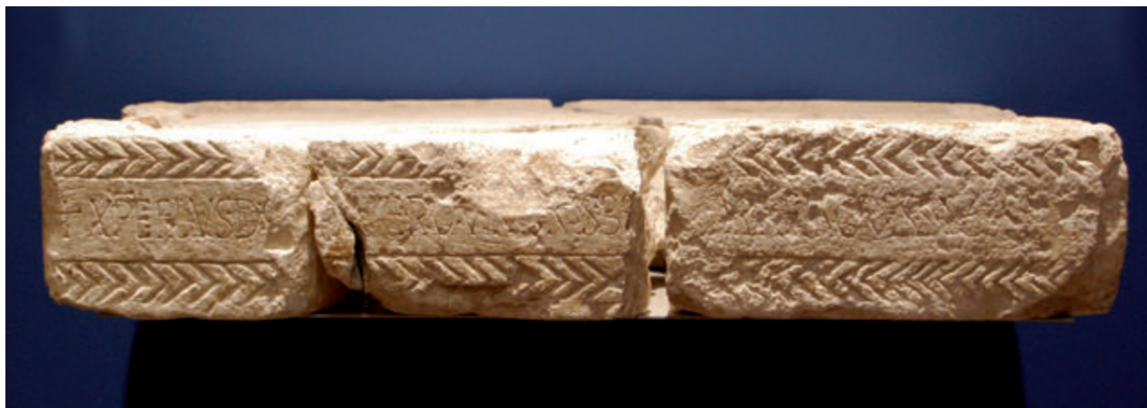
Figura 8. Mesa del altar de Santa María de Naranco, Museo Arqueológico de Asturias.

1892:206, 230) 32 . De los dos edificios del monte solamente el conocido como Santa María de Naranco tiene fajones, nueve en el piso superior y cuatro en el inferior. San Miguel de Lliño carece de ellos y no es probable que los haya tenido.