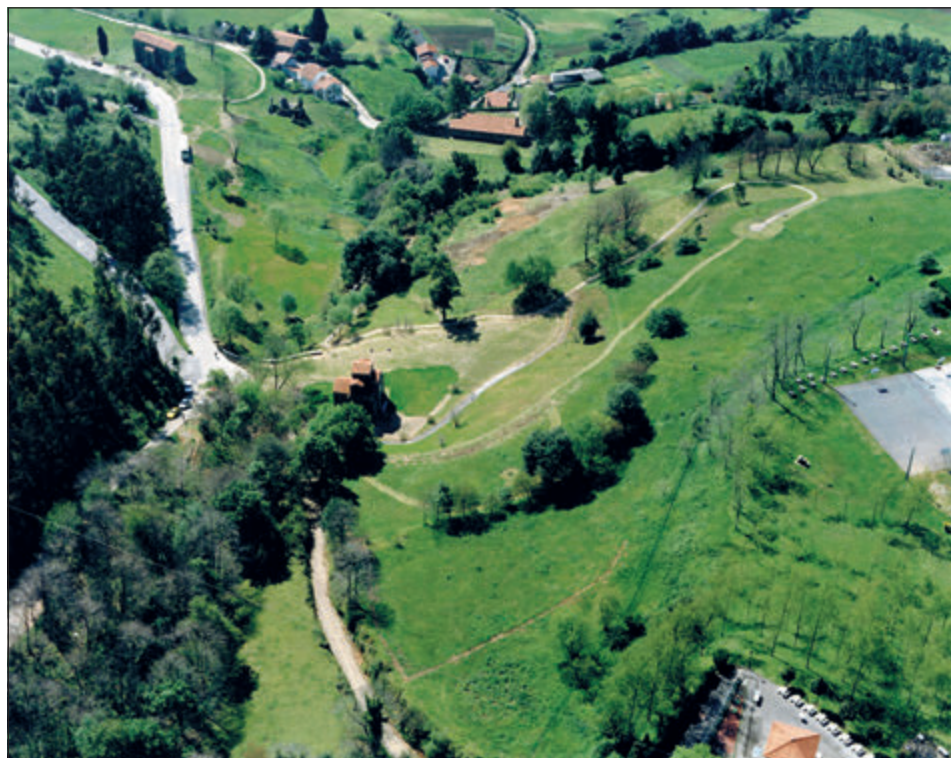
Figura 10. Santa María de Naranco y San Miguel de Lliño, vista aérea desde el oeste.

estimarse a la luz de los levantamientos topográficos y de las huellas en la propia finca en unos 2500 m 2 . En esta terraza fueron excavados los cimientos del muro sur (Arias Páramo y Olávarri 1987). Si hubiera habido voluntad de construir juntos templo y edificio representativo, la actuación en Naranco habría permitido perfectamente, aumentando la superficie de la terraza artificial, construirlos juntos, en una situación topográfica mucho más favorable. Por el contrario, San Miguel se levanta sobre una plataforma natural de coluvión formada por el deslizamiento de ladera, sin mayor preparación humana (Ulreich, en Noack-Haley y Arbeiter 1994:53). Esta plataforma se ha formado en un fondo de saco, al oeste –margen derecha– del barranco formado por el denominado arroyo de los Pastores, que nace en la fuente homónima, surgente a unos 160 m en línea de aire ladera arriba del templo, y al pie justamente de una fuerte ruptura de pendiente, que ha impedido el asentamiento poblacional a cota superior, circunstancia que solamente ha sido modificada en época contemporánea con la construcción de una casería aislada en la margen derecha de dicho arroyo. El actual aspecto del entorno topográfico de San Miguel es el resultado