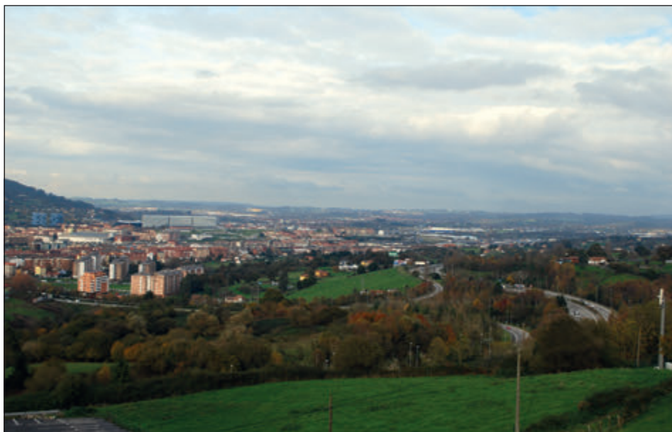
Figura 7. Valle del Nora al este de Oviedo.

Vega 1991:18-19) 27 . Cabe suponer, por ello, que a la confirmación de Fernando II se presentó una minuta documental debidamente ajustada a la realidad, pues en toda la documentación posterior del monasterio no se recoge otra mención del supuesto dominio sobre este territorio. El asunto se complica si añadimos al caso el hecho –impreciso, pero firme, dada la autoridad de la fuente– de que en 1178 el mismo Fernando II donó a Gundisalvus Iohannis, canónigo ovetense, «el monte de Naranco, culto e inculto, según lo llevaban en foro sus pasados y era de Bermudo Fafilaz» (Miguel Vigil 1887:92) 28 . El tal Gundisalvus Iohannis recibió en beneficio en 1186 una heredad en Escontriella, Brañes, en la ladera noroccidental del monte, junto al Nora (García Larragueta 1962:492), y su fallecimiento, un 10 de junio, figura registrado en el obituario de San Salvador (Rodríguez Villar 2001:278) 29 . Es probable que el propietario precedente, Vermudo Fafilaz, pueda identificarse con el confirmante de varios actos documentales promovidos por Alfonso VI a favor de San Salvador de Oviedo, en 1097, ca. 1100 y 1106 (García Larragueta 1962:302; 319; 337; Valdés Gallego