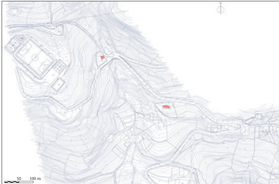
Figura 9. Plano topográfico del sector del Monte Naranco donde se emplazan los dos edificios. Según Cosme Cuenca y Jorge Hevia.

de su conceptualización. Y solamente la profundización en lo concreto aporta enriquecimiento ontológico. La progresiva determinación/delimitación del ser va otorgando mayor realidad al ente.