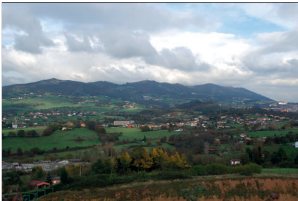
Figura 2. Sierra del Naranco, vertiente sur, hacia el este.

que se extiende al pie septentrional del Monte, los conocedores del río, pues a los habitantes del sur la existencia de este les está oculta por el propio relieve. La primera aparición del topónimo Naranco referido al monte, lo que indica que pasa a ser denominado por los habitantes de la ladera meridional, data de 1124 en la documentación del monasterio de San Vicente (Floriano Llorente 1968:272; García de Castro 1995:406) 3 . A partir del siglo XIII la sustitución del topónimo es completa. El romance «Cuesta de Naranco» apenas tiene presencia documental medieval, pese a que lo recogiese Ambrosio de Morales en 1572 (1765:102), lo que indica que algún uso tenía entre los ovetenses. Tirso de Avilés, coetáneamente, menciona en todo momento la cuesta de Naranco (1956:203-204).