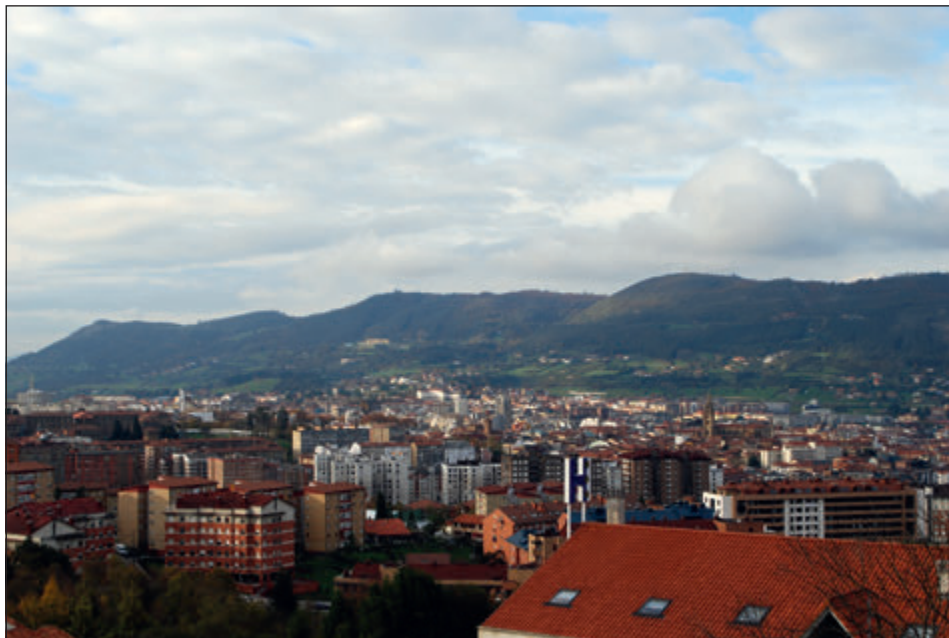
Figura 1. Sierra del Naranco, vertiente sur, hacia el oeste.

a una cota entre 350 y 400 m se encuentran diversos rellanos horizontales cuyo escalonamiento de oeste a este es el producto de las sucesivas fallas que afectaron el macizo. Estos rellanos han sido aprovechados históricamente para el asentamiento humano (Figura 2).