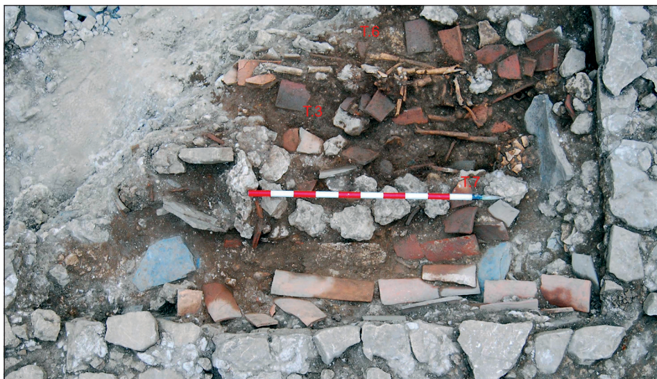
Figura 5. Segunda fase de enterramientos.

fecha, en nuestro ámbito territorial, no es, sin embargo, insólito en otros contextos como el levantino, con ejemplos como los de diversas tumbas de la necrópolis tardorromana del Molino (Águilas, Murcia) (Hernández García 1998: 179), o buena parte de las de la Molineta (Puerto de Mazarrón) (Amante Sánchez y García Blázquez 1998). Los bloques de esta estructura original serían reaprovechados, con toda probabilidad, en las fábricas de inhumaciones posteriores, que se superponen sobre ella en ese mismo lateral.