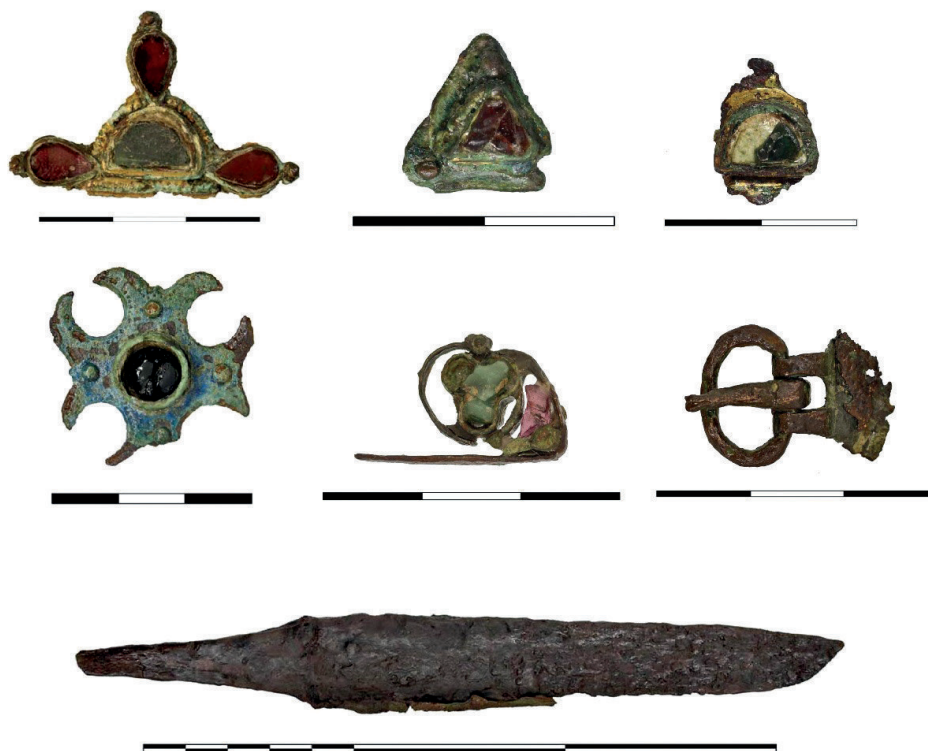
Figura 7. Restos de cinturón y cuchillo pertenecientes a la tumba A.

corrimiento de tierras que propició el descubrimiento de la necrópolis durante la construcción de un depósito de aguas. No obstante, su mitad superior fue seccionada en estas obras, por lo que solo conservamos los restos del individuo desde la pelvis. Este enterramiento, aparte de por la presencia de ajuar y ricos ornamenta , destaca por su estructura perimetral, compuesta por bloques alineados que formaban un pequeño túmulo. La disposición de los clavos encontrados parece indicarnos que el inhumado, de sexo masculino, fue enterrado en un catafalco, práctica común en los enterramientos tardoantiguos, con ejemplos como la tumba 91 de la necrópolis de Valduno (Asturias) (Estrada García 2014:140) o las diversas sepulturas del área de enterramiento tardoantigua de Tossal de les Basses (Alicante) (Rosser Limiñana y Soler Ortíz 2015:150).