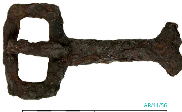
Figura 6. Hebilla de cinturón recuperada en la tumba 2.

el segundo cuarto del s. IV d. C. principios del s. V d. C. (Blaizot et al. 2008), o las ya más tardías de la villa de Veranes (Fernández Ochoa y Gil Sendino 2007:157).