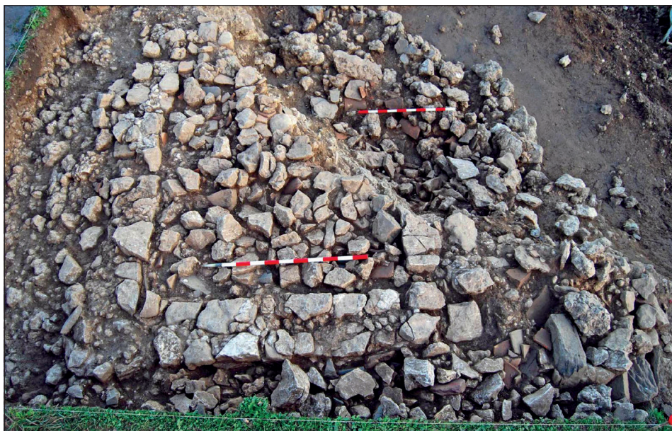
Figura 1. Planta del edículo, desde el oeste, antes de su excavación.