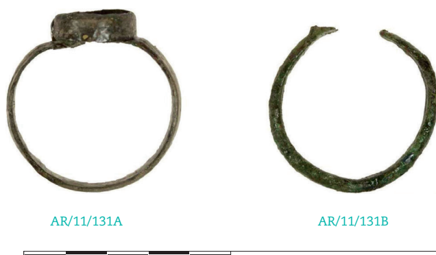
Figura 2. Sortijas pertenecientes a los ornamenta de la tumba 14.

Se han encontrado paralelos de esta pieza en las tumbas 147 y 176 de la necrópolis de Duratón (Molinero Pérez 1971: lám. XII y XIV). La segunda sortija está formada por una pletina de bronce, lisa, de 20 mm de diámetro, con sección semicircular y con una protuberancia en su remate superior que evidencia que contaba con algún tipo de engarce. El resto de los ornamenta lo conforman dos brazaletes filiformes de una aleación de bronce, con un diámetro en torno a los 65 mm, y muy comunes en los repertorios de las necrópolis clásicas de la península, como Duratón en sus tumbas 200-211 y 294. (Molinero Pérez 1971: lám. XVII y XIX). Así como un zarcillo, o arete, también filiforme y del mismo material, que cuenta con uno de sus extremos apuntado, mientras que en el opuesto se ha perdido su terminación por una fractura. Esta fractura imposibilita que se pueda asociar con seguridad a una tipología, no obstante, parece corresponderse con uno de los modelos más simples, con paralelos en la sepultura 20 de la necrópolis de Tinto Juan de la Cruz (Barroso Cabrera et al. 2006: 544 y 556), o las tumbas 30 y 34 de Segobriga (Almagro Basch 1975:29 y 33).