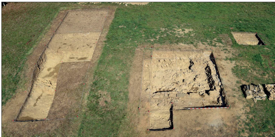
Figura 8. Segunda campaña de excavación. Vista general.

Deben tenerse en cuenta, por último, en relación con este cingulum tres apliques más: un vástago laminar, de sección rectangular, y varias celdillas, unidas por remaches de cabeza redondeada, de las cuales la central tiene forma de trébol, un aplique de una aleación cúprica y chapado en oro con forma triangular, y un cabujón central de pasta vítrea; y otro –del mismo material que el anterior– que conserva una parte de la placa metálica (11 x 15 mm) sobre la que se dispone un cabujón de morfología oval.