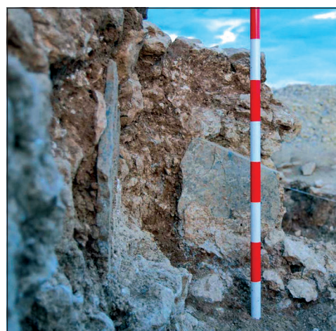
Figura 4. Esquina noreste del edículo con las dos lajas de pizarra encajadas de la tumba 13.

Esta tumba junto a las 10, 11, 12 y 13 conforma la primera fase de enterramientos en el edículo, caracterizada por la presencia de fosas que acogen inhumaciones simples o con ataúd, probablemente cubiertas por una capa de tierra y piedra (Figura 3). Dentro de esta primera fase, además de la tumba 14, por ser probablemente la fundacional, debe destacarse la tumba 13, por contar con unas cuidadas lajas de pizarra, apenas conservadas, que se encontraban encajadas en su cara interna (Figura 4). Este acabado, sin paralelos conocidos hasta la