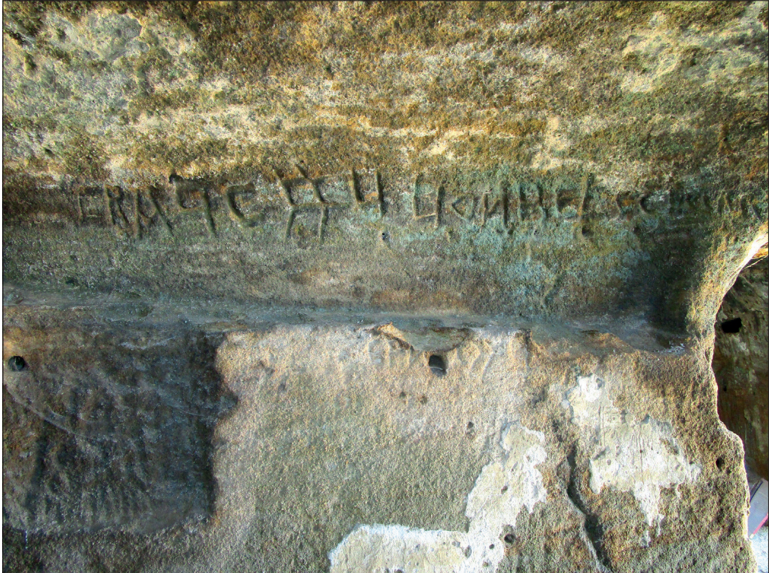
Figura 4. Inscripción situada en la cámara occidental de la iglesia.