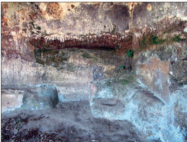
Figura 6. Nacimiento de plantas y de poiquilohídricos en el interior de la iglesia debido a los altos niveles de humedad.

En la última visita, realizada en 2017, un vecino de Villarén se acercó a nosotros para informarnos que desde hacía varios meses un rebaño de ovejas paseaba cada semana sobre el templo, erosionando una serie de sepulturas antropomorfas. Esta misma tipología de enterramientos se encuentran en la iglesia de Santa María de Valverde (Valderredible, Cantabria). Así como se erosionan las tumbas, el grosor de la techumbre se reduce cada año considerablemente, ya que el tipo de roca que