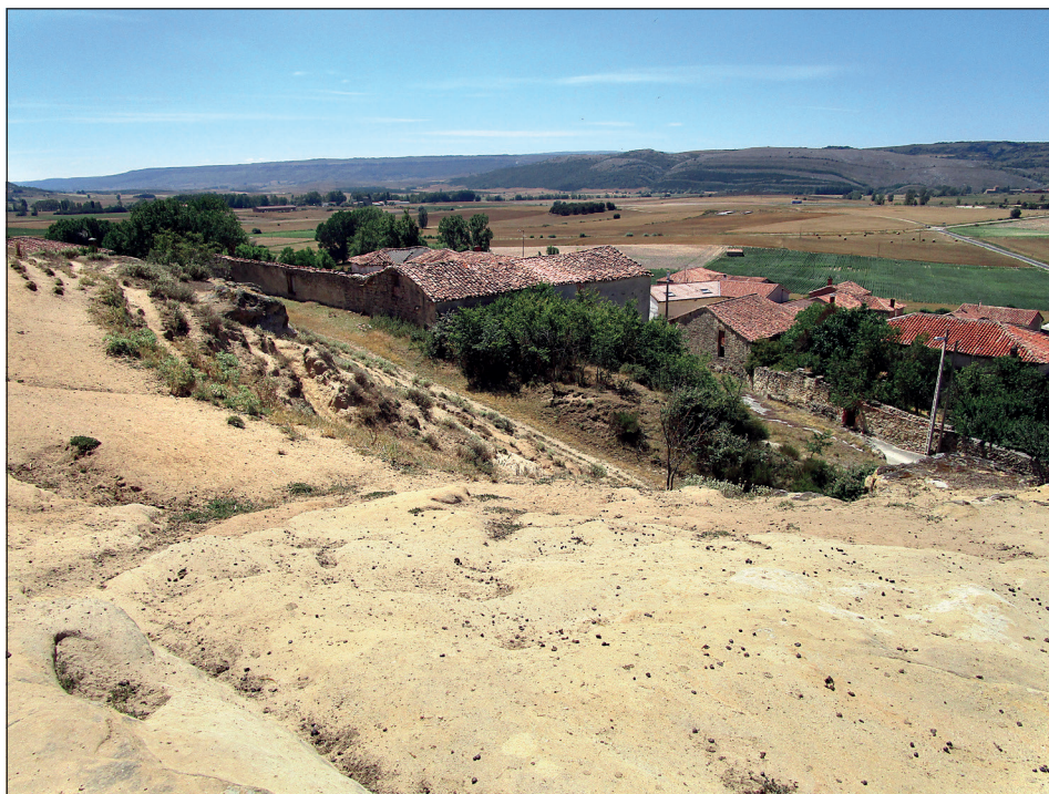
Figura 1. Vista del Valle de Valdivia (Pomar de Valdivia, Palencia) desde la iglesia de San Martín.

drussianus ) 1 , situado al este, se subdivide en dos pequeñas naves (la septentrional de mayor tamaño que la meridional) con sus respectivos ábsides, de morfología rectangular, perfectamente orientados al levante (Figura 2) (Bohigas Roldán 2014:162). Estos ábsides, conectados a través del muro por un pequeño vano, presentan bancos corridos adosados a los muros de la nave (Figura 3), los cuales continúan su desarrollo a lo largo de todo el templo. En el acceso a los ábsides, llama poderosamente la atención el cuidado con el que se han labrado los arcos perpiños de medio punto que dan acceso a este reducido espacio. La cubierta de la nave principal y del ábside septentrional simula una bóveda vaída, mientras que la nave y el ábside meridional recuperan la bóveda de cañón tan repetida en la arquitectura prerrománica (Bohigas Roldán 2014:162).