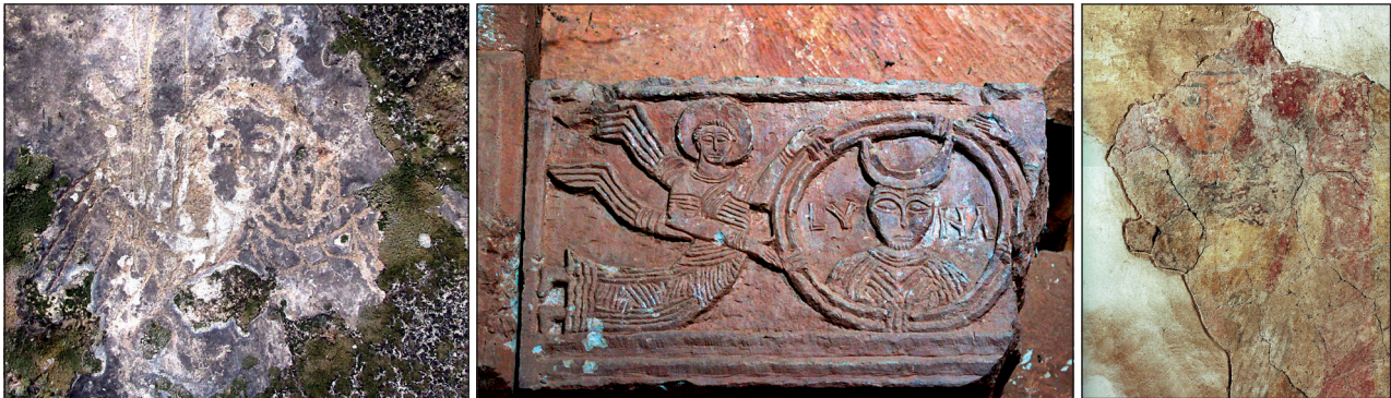
Figura 5. A la izquierda se muestra una imagen del ángel grabado en la ermita de San Martín (Villarén de Valdivia, Palencia). En el centro, uno de los relieves que presenta un ángel en la iglesia de Quintanilla de las Viñas (Mambrillas de Lara, Burgos). Y a la derecha, el fresco que contiene la figura del músico, en el templo asturiano de San Miguel de Lillo, del que existe copia en el Museo Arqueológico de Asturias (Oviedo, Asturias).

En 2016 regresamos a Villarén de Valdivia. El cartel se encontraba en el interior del templo completamente abollado y tirado sobre el suelo, concretamente sobre una pequeña sepultura olerdolana que se encuentra en la nave norte de la cámara principal. En la zona del ábside pudimos observar restos de hogueras, pinturas en las paredes y grabados de la década de los años 80 del siglo XX.