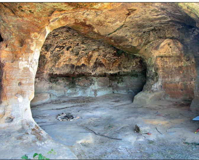
Figura 2. Interior de la ermita de San Martín de Villarén de Valdivia.