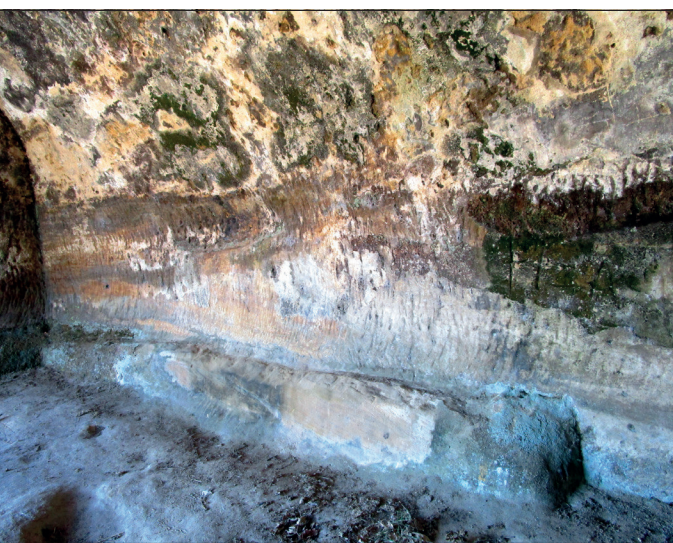
Figura 3. Detalle del banco corrido de la nave septentrional de la iglesia.

cuentran elementos inusuales y que suscitan un debate en torno a su cronología y función. En la parte superior del muro aparece una inscripción epigráfica que señala la posible fecha de fundación del templo, aunque, debido a su compleja caligrafía, no se ha dilucidado todavía el año o periodo al que podría aludir. Tal y como señala Bohigas Roldán (2014:163), Carrión Irún y García Guinea leen ERA DCCCV HON ORE S(a)C(nt)I MARTI, cuya interpretación se traduce como «En la ERA 805 (767 d. C.) en honor de San Martín» (Carrión Irún y García Guinea 1968). Por el contrario, Monreal Jimeno adelanta su construcción casi dos siglos proponiendo la siguiente lectura: ERA DCXXV HONORE S(an)C(t)I MARTÍN, es decir, «En la Era 625 (587 d. C.) en honor de San Martín» (Monreal Jimeno 1989). Bajo este epígrafe se encuentran un total de trece concavidades a modo de piletas labradas sobre una repisa en posición horizontal (aproximadamente 16,5 centímetros de diámetro cada concavidad= 0,5 pes drussianus ) cuyo significado se ha puesto en relación con rituales bautismales (Monreal Jimeno 1989:36). Esta cámara supone un interrogante en la historia de San Martín ya que no hay una hipótesis clara que defina su función, aunque, sin duda, la posibilidad de su uso como baptisterio podría ser aceptada. (Figura 4).