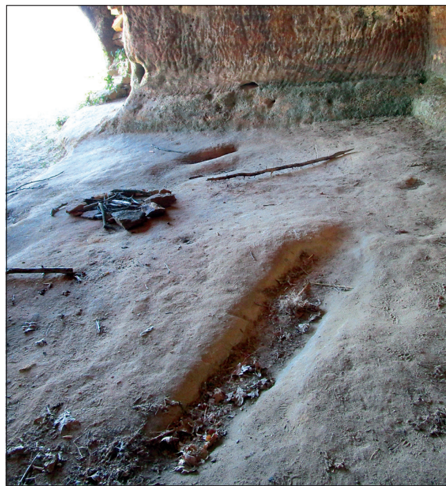
Figura 7. Desperfectos y restos de vandalismo en la iglesia de San Martín.

La metodología de trabajo es compleja ya que conlleva la combinación de diversas técnicas para obtener el mejor resultado y, posteriormente, un