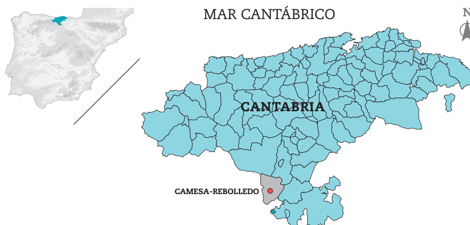
Figura 1. Ubicación del yacimiento de Camesa-Rebolledo.

Desde El Conventón y los parajes adyacentes, sobre un espolón orientado al sur a 985 m de altitud, se obtiene el dominio visual completo de los terrenos inferiores inmediatos. Hacia el oeste y el suroeste se visualiza la vega del río Camesa, cuyos llanos cultivados son casi visibles hasta las proximidades de Aguilar de Campoo, a más de 12 km de distancia. Por el sureste se sigue el corredor de Pozazal, paso principal hacia el valle de Campoo y lugar por donde discurrió la vía romana que unía la Cantabria trasmontana con la Meseta (Cepeda Ocampo 2004:393). La cuenca visual es más modesta hacia el norte, donde el paisaje que circunda los pueblos de Rebolledo y Camesa es más quebrado, teniendo como telón de fondo los montes de Ornedo-Santa Marina y El Otero.