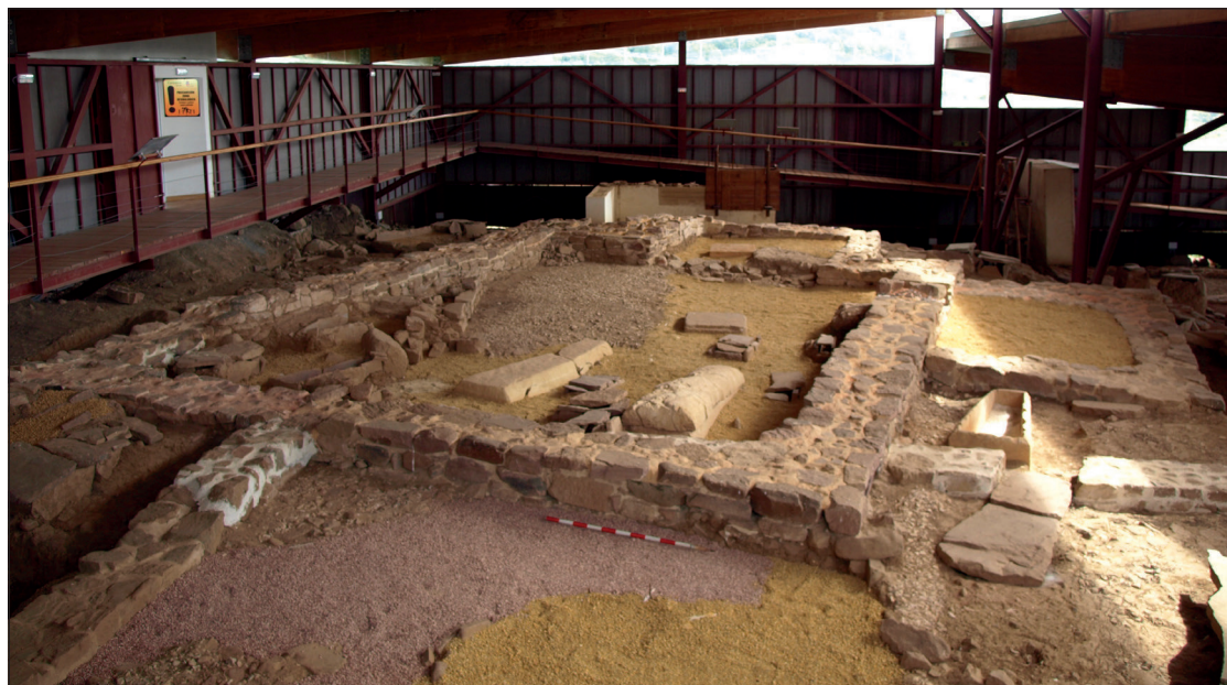
Figura 3. Estado actual de los restos arqueológicos de la iglesia prerrománica de El Conventón.

dos mediante dos lienzos de mampostería careada al exterior, con un espacio central de relleno con ripio y trabados con argamasa. Consta también de un anexo al sur, interpretado como una capilla o pórtico de acceso por el mediodía. Este cuerpo meridional es un añadido posterior al adosarse y no imbricarse al muro sur y superponerse a una tumba de lajas.