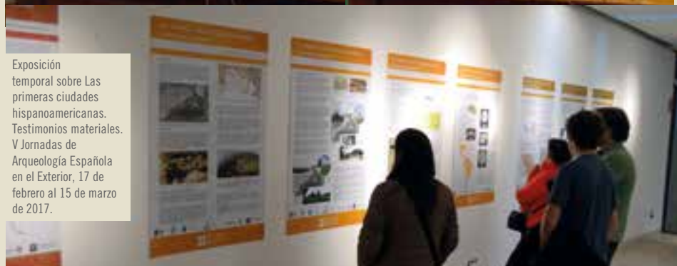
Exposición temporal sobre Las primeras ciudades hispanoamericanas. Testimonios materiales. V Jornadas de Arqueología Española en el Exterior, 17 de febrero al 15 de marzo de 2017.